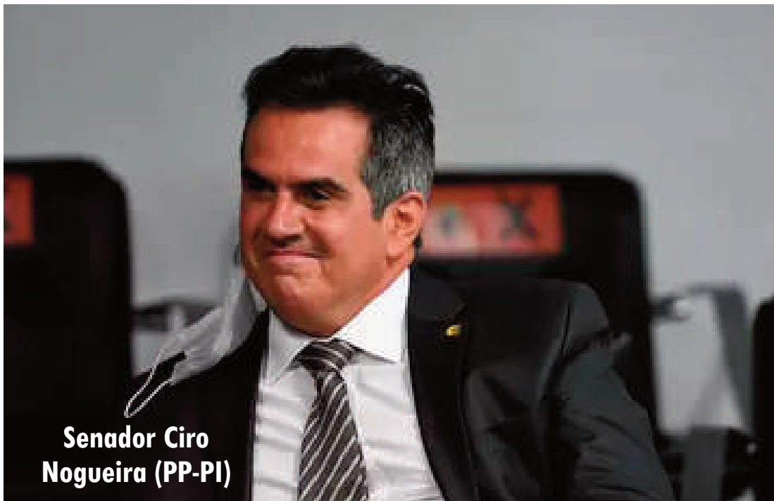
Senador Ciro Nogueira (PP-PI)