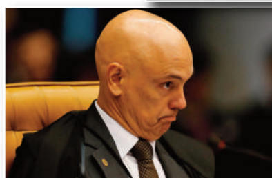
Alexandre de Moraes

Para Cármem Lúcia: "Em algumas datas (...) se dava, por exemplo, no ano de 2012, período em que nós estávamos aqui reunidos e o Brasil assistia pela primeira vez a este Supremo Tribunal Federal julgar a Ação Penal 470, que dizia respeito a crimes como esse: organização criminosa, corrupção passiva, lavagem de capitais. E nada disso causou qualquer temor, parece, a uma parte de pessoas que estavam a praticar atos denunciados depois pelo Ministério Público e, pelo menos até agora, tidos como comprovados".