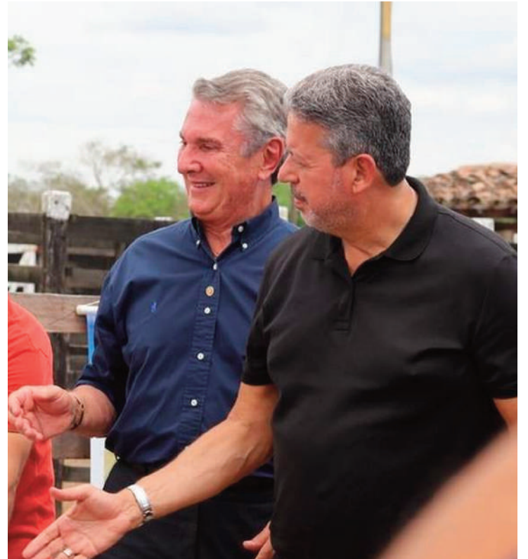
Alagoas merece representantes políticos que trabalhem para o progresso, a transparência e a ética.

A exposição constante de Alagoas nas páginas policiais do país prejudica a imagem do estado como um todo, afetando o turismo, os investimentos e até mesmo a autoestima dos alagoanos. O potencial de Alagoas para se destacar como uma região de belezas naturais e riquezas culturais é obscurecido por essas ações negativas, afastando possíveis visitantes e investidores.