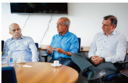
Representantes dos hospitais, na sede da Vice-Governadoria, articulada pelo vice-governador Ronaldo Lessa