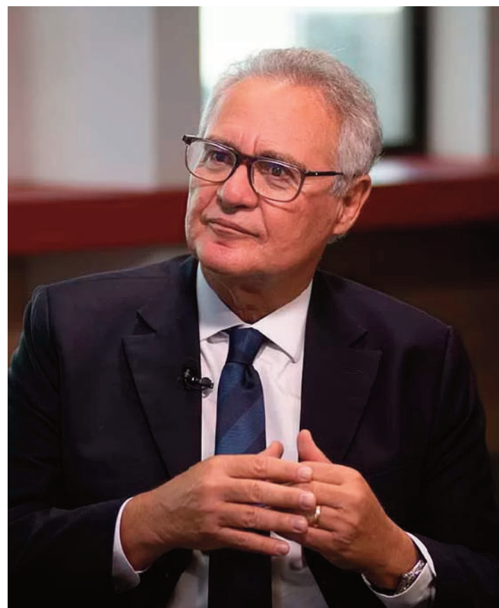
Calheiros afirma que derrota de Bolsonaro no TSE evidencia crimes e ressalta papel da polícia