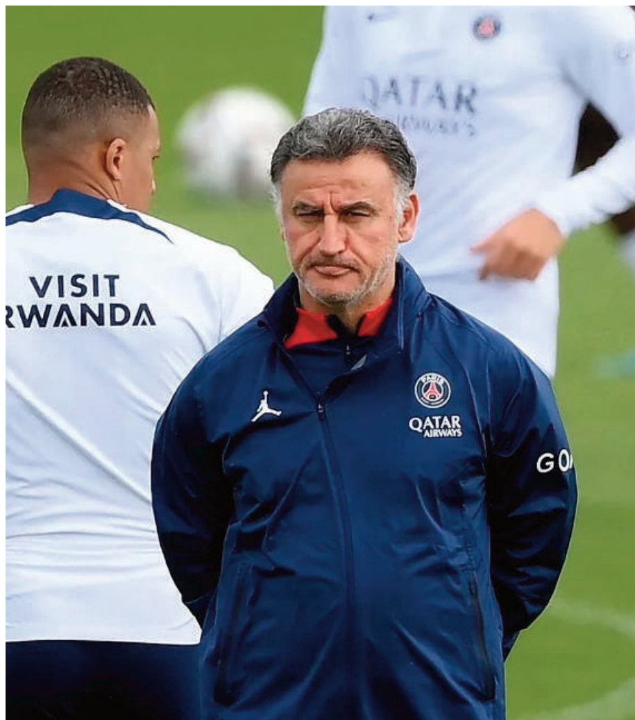
Christophe Galtier era investigado pelo Ministério Público de Nice, por ofensas a jogadores em 2021-22

Além do problema com a justiça, Galtier também terá que lidar com seu futuro como treinador. Apesar de ter contrato com o PSG até 30 de junho de 2024, o clube parisiense informou a Galtier no início de junho que ele não estará à frente da equipe na próxima temporada. O espanhol Luis Enrique, ex-Barcelona e Espanha, deve assumir o cargo.