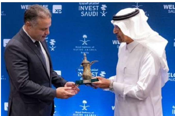
entregues pessoalmente pelo ministro de Investimentos da Arábia Saudita, Khalid Al-Falih, durante um evento em São Paulo.

Os presentes recebidos por Haddad e Alckmin, que eram réplicas de animais feitos com pedras preciosas e ouro, foram