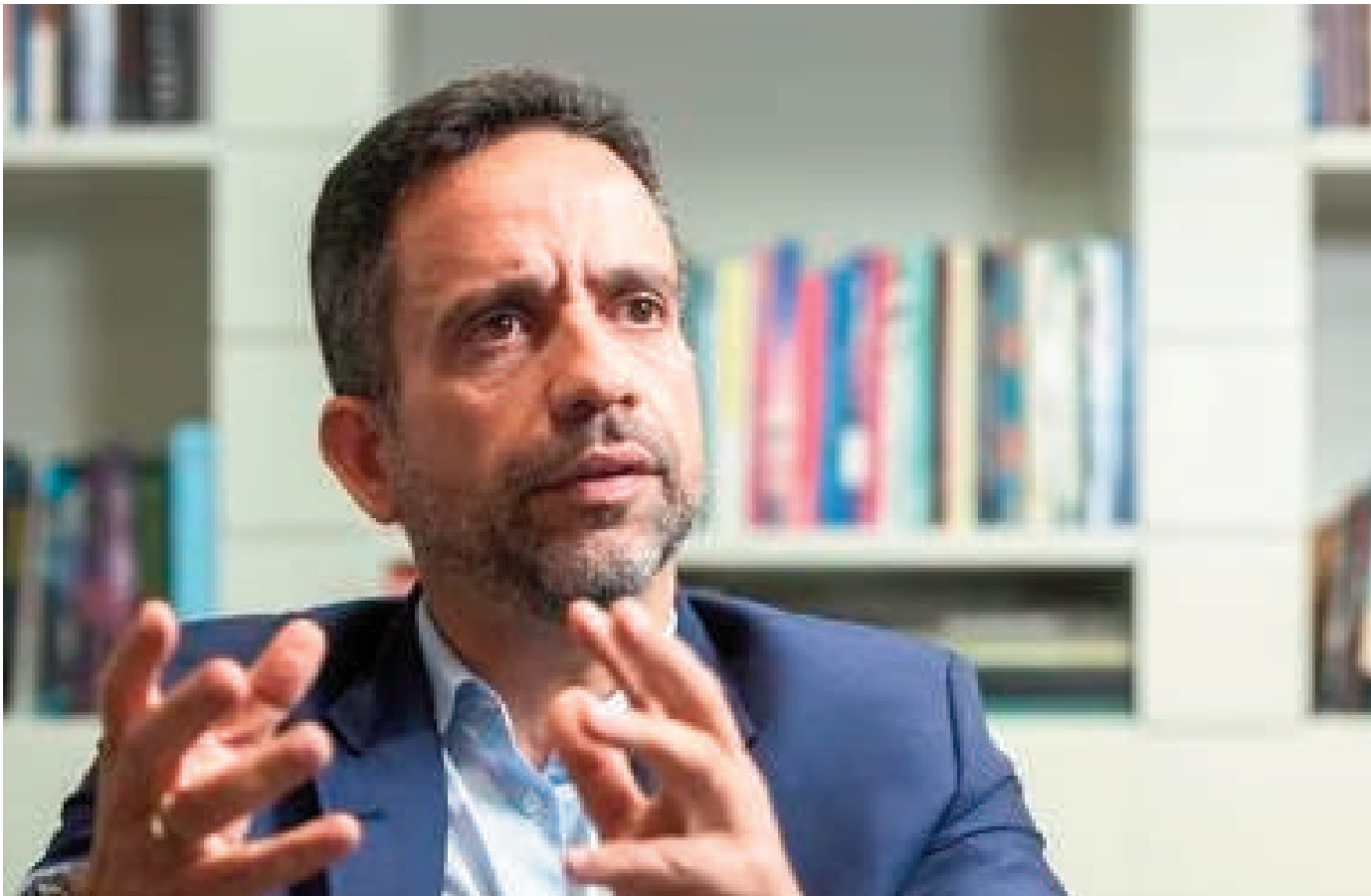
Resta saber se essa é uma mensagem direta aos opositores do MDB em Alagoas

Os recentes pronunciamentos de Dantas geraram especulações sobre as futuras estratégias políticas do Palácio República dos Palmares para 2024.