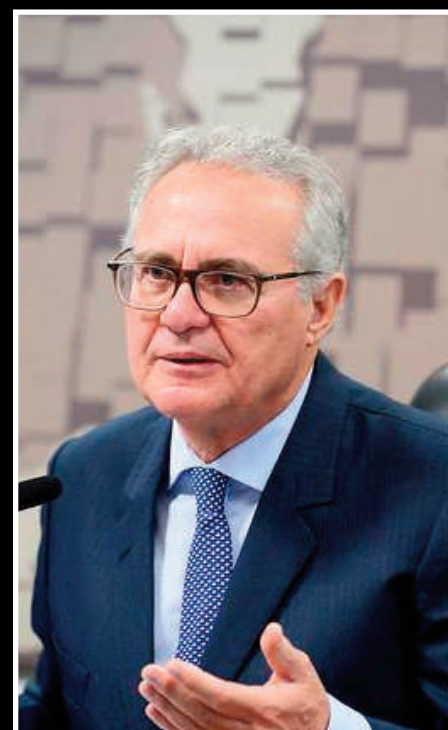
Renan ressaltar que o hospital foi comprado sem licitação, avaliação e sem audiência pública