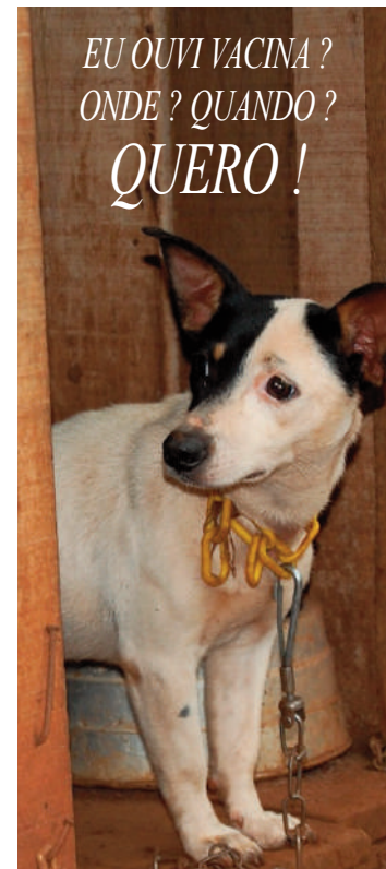
Os pets são bem mais inteligentes do que a gente imagina

40 mil cães e gatos nos dois primeiros dias, a mobilização continuará nos dias 25 e 26 deste mês nas localidades situadas na parte baixa de Maceió. A ação visa reforçar a prevenção da raiva, uma doença infecciosa viral aguda que afeta mamíferos, incluindo os seres humanos,