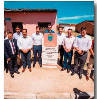
Marechal Deodoro recebeu investimentos urbanos por meio do Pró-Estrada

Nesta quarta-feira, em comemoração aos 134 anos da Proclamação da República do Brasil, o governador Paulo Dantas, junto ao prefeito Cláudio Filho, o "Cacau", marcou a instalação da sede administrativa do Governo do Estado em Marechal Deodoro com uma celebração pela entrega de obras estruturantes.