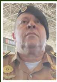
CORONEL DO VALE