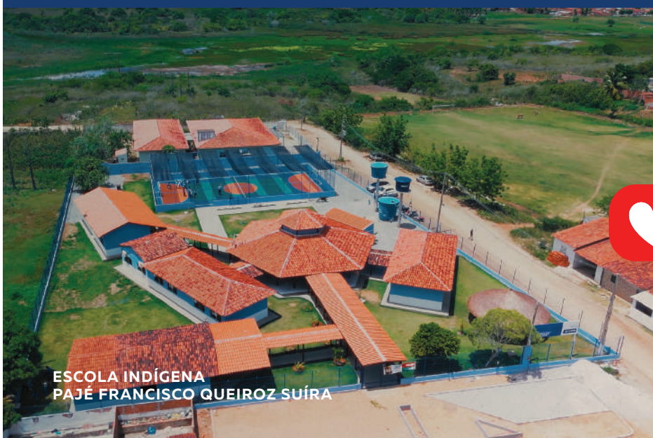
ESCOLA INDÍGENA PAJÉ FRANCISCO QUEIROZ SUÍRA

Tem Governo trabalhando. Em todo canto tá chegando.