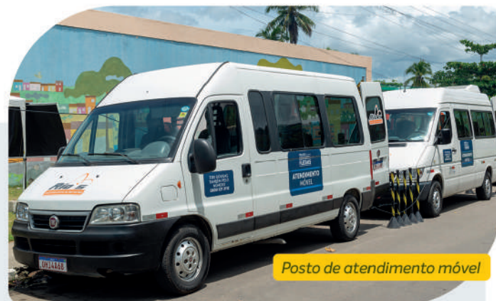
Posto de atendimento móvel