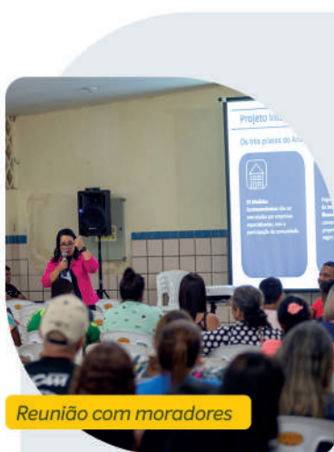
Reunião com moradores