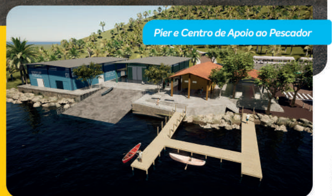
Pier e Centro de Apoio ao Pescador

Entre as 23 ações para a integração urbana e o desenvolvimento da região também estão previstas a requalificação viária da rua Tobias Barreto, a construção de uma creche-escola e a instalação de um píer de acesso à Lagoa Mundaú, todas com início neste ano. Além das obras, os moradores estão recebendo indenizações e um repasse de R$ 64 milhões foi feito ao Município de Maceió para medidas adicionais.