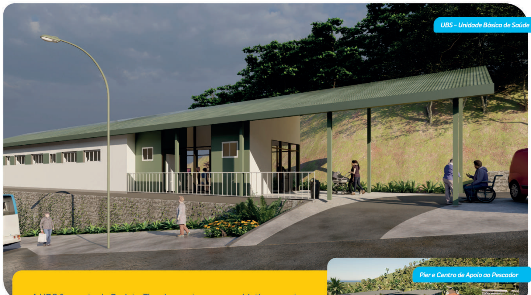
UBS - Unidade Básica de Saúde

Compensação e requalificação de serviços de uso público de saúde, educação e atenção social das áreas afetadas