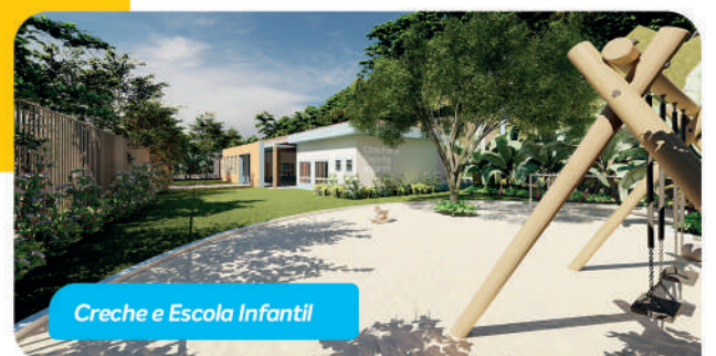
Creche e Escola Infantil