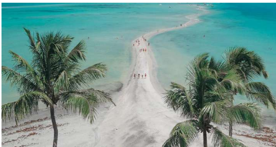
Caminho de Moisés - Maragogi