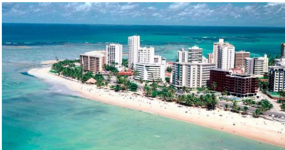
Praia da Ponta Verde - Maceió

(BA), João Pessoa (PB), São Paulo (SP), Foz do Iguaçu (PR), Maragogi (AL), Fernando de Noronha (PE), Aracaju (SE), Balneário Camboriú (SC), Curitiba (PR), Belo Horizonte (MG), Ilhéus (BA), Navegantes (SC) e Costa do Sauípe (BA).