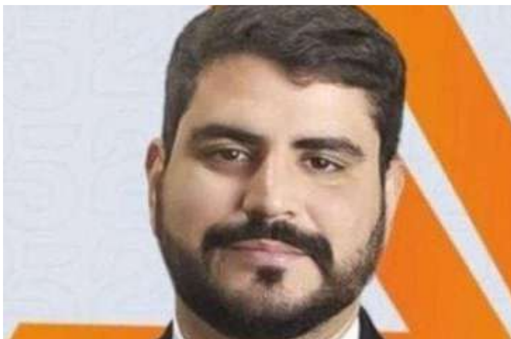
Chefe da guarnição, acusado de efetuar o disparo que matou empresário, foi pronunciado por homicídio qualificado