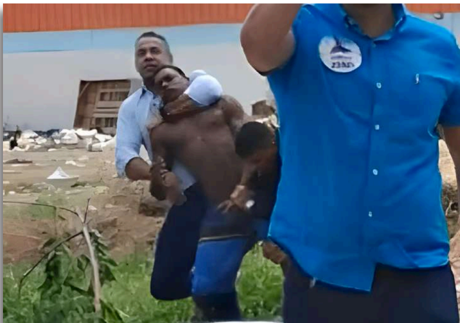
Vereador foi flagrado aplicando "mata-leão" em morador de rua no bairro do Benedito Bentes

Essa ação reforça a discussão sobre a aporofobia, conceito que se refere à aversão a pessoas em situação de pobreza. Além de coibir práticas abusivas, a decisão judicial busca garantir a dignidade e os direitos das pessoas vulneráveis em Maceió, destacando a necessidade de um tratamento humanitário e respeitoso para todos os cidadãos, independentemente de sua condição social.