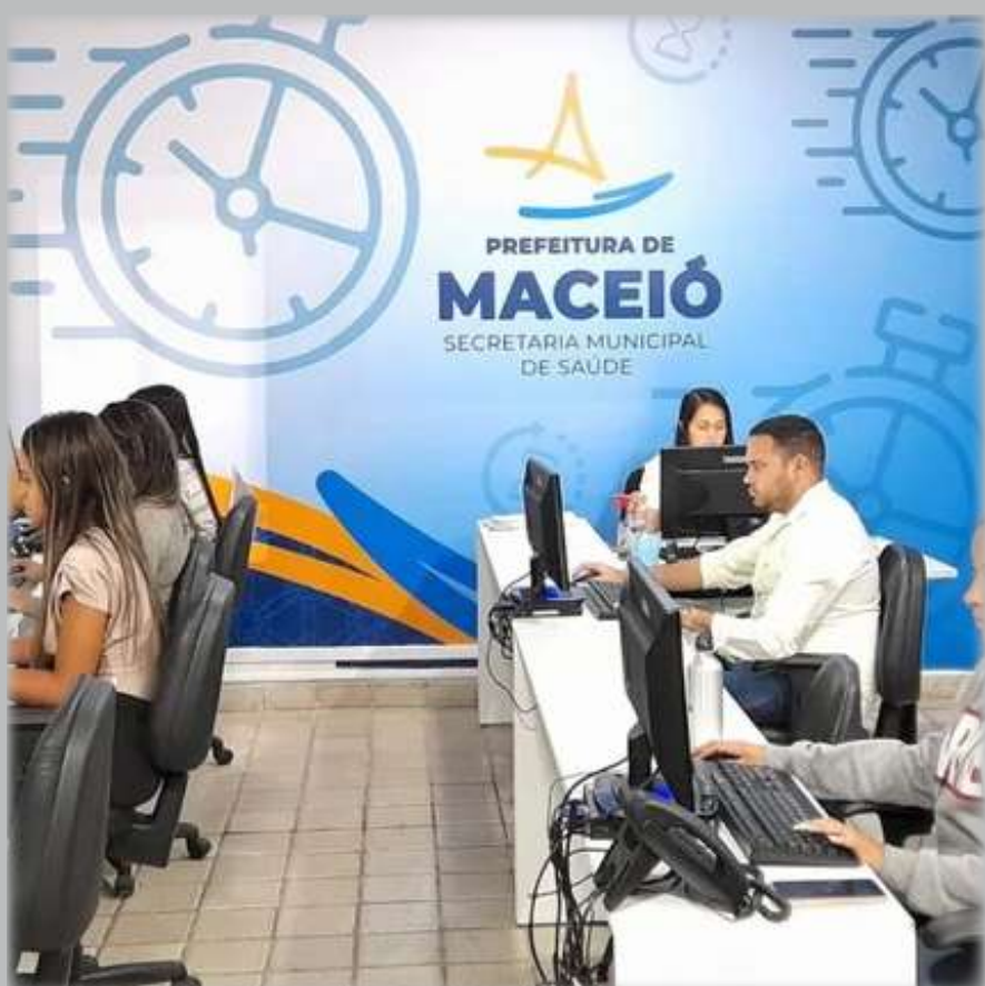
Com o fim do Cora, sistema surgiu com a promessa de agilizar a marcação de exames e consultas médicas

A iniciativa do Ministério Público encontra respaldo na Lei nº 8.080/90, que estabelece a saúde como um direito fundamental e impõe ao Estado a responsabilidade de garantir condições adequadas para seu pleno exercício. A investigação do MPAL se torna, portanto, uma medida necessária para assegurar que as políticas públicas em saúde sejam efetivas e que os maceioenses tenham acesso a um atendimento digno e de qualidade. A sociedade aguarda ansiosa por respostas e ações concretas que revertam esse quadro preocupante.