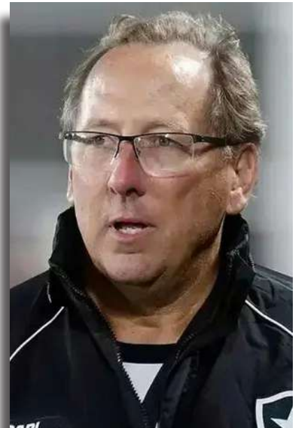
para novos desafios, com um projeto de crescimento contínuo e reforços de peso para 2025.

Com a liderança consolidada no Brasileiro e o elenco em ascensão, o Botafogo de Textor segue com grandes ambições para o futuro. O próximo compromisso do time será no sábado, contra o Cuiabá, no Nilton Santos, e a expectativa é de mais uma demonstração da força do clube, que se prepara