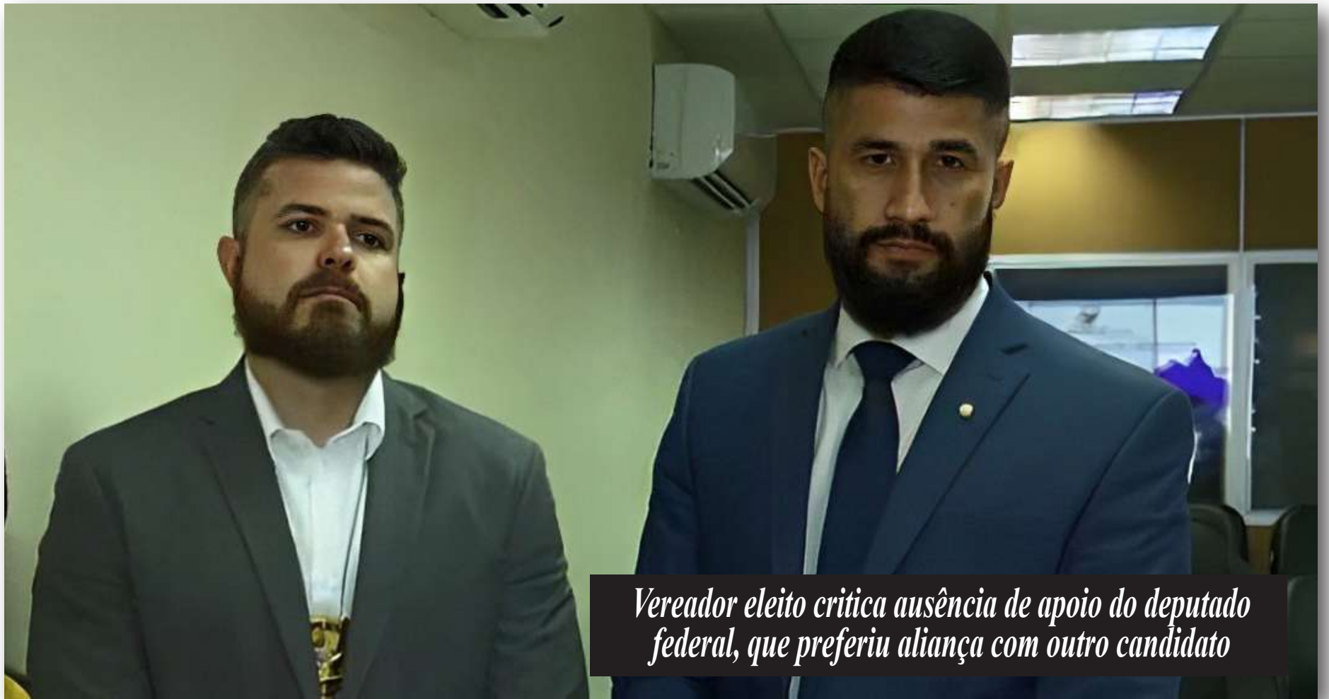
Vereador eleito critica ausência de apoio do deputado federal, que preferiu aliança com outro candidato