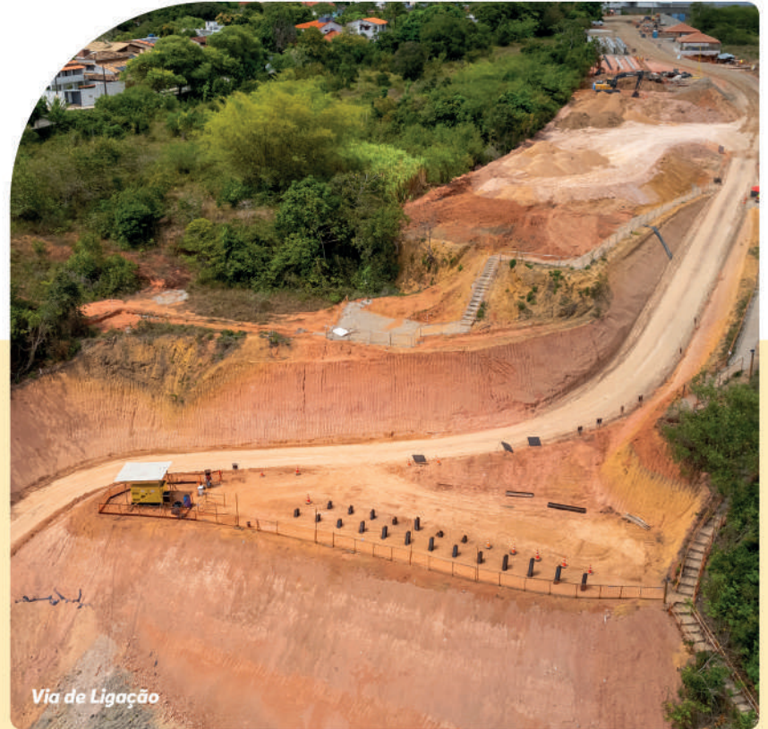
Via de Ligação